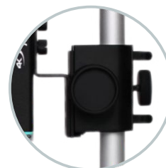
Regulowana przestrzeń robocza