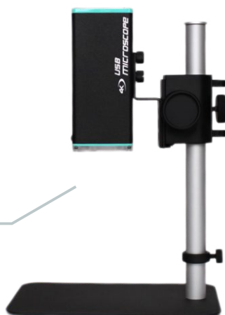
Wymiary: 64 x 48 x 150mm