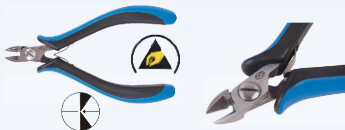
RG 90R Nr kat. 311101