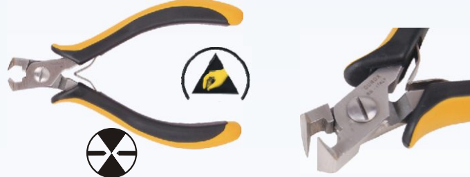
RG HM316S Nr kat. 311106