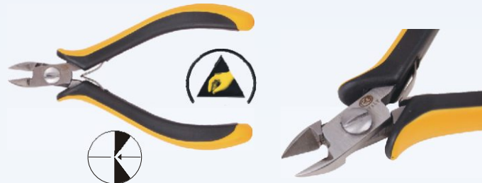
RG HM201 Nr kat. 311105