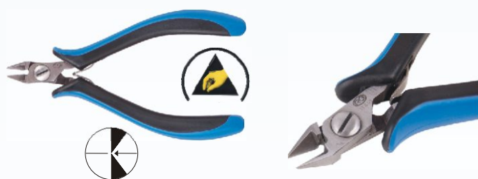
RG A90R Nr kat. 311103