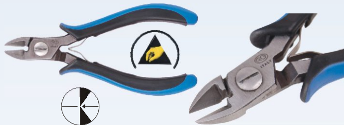
RG 100R Nr kat. 311100