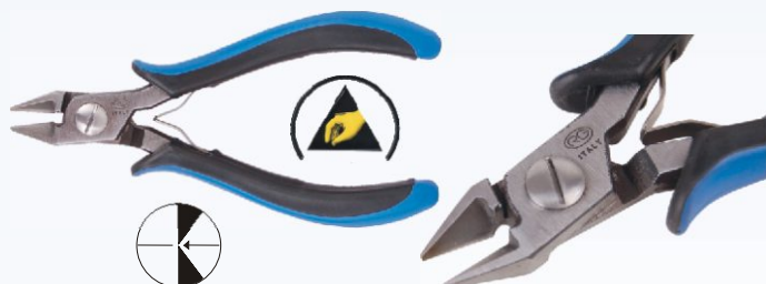
RG A100R Nr kat. 311102