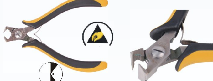
RG HM18 Nr kat. 311107