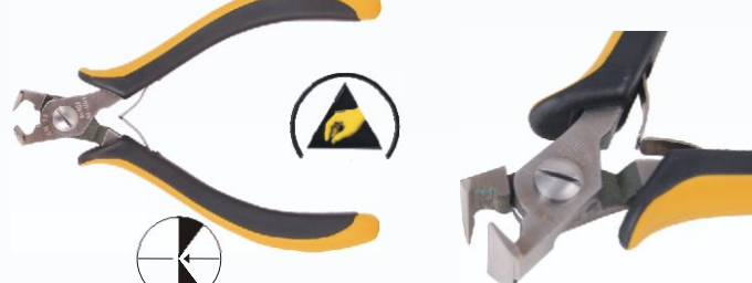
RG HM18 Nr kat. 311107