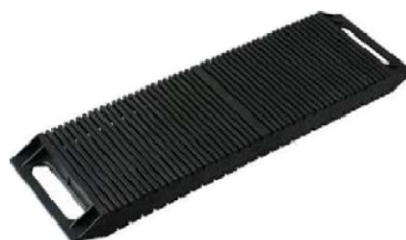
SL-D02 dwustronny rack ESD na płytce PCB Nr kat. 202852

Pojemność: 38 sztuk płytek PCB Wymiar PCB: 225 × 140 [mm] Wymiar (szer × gł × wys): 410 × 280 × 165 [mm]