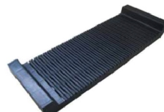
SL-D07 rack ESD na płytce PCB Nr kat. 202856

Pojemność: 5 sztuk płytek PCB Wymiar szczeliny: 3 × 7 [mm] co 16 [mm] Wymiar (szer × gł × wys): 437 × 160 × 30 [mm]