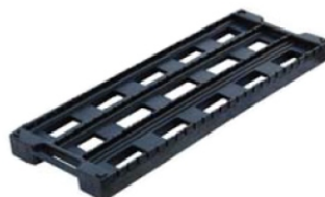
SL-D05 rack ESD na płytce PCB Nr kat. 202855

Pojemność: 42 sztuk płytek PCB Wymiar szczeliny: 2,8 × 5 [mm] co 10 [mm] Wymiar (szer × gł × wys): 410 × 140/280 × 22 [mm]