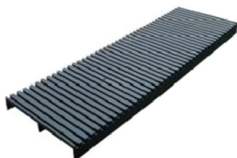
SL-D04 dwustronny rack ESD na płytce PCB Nr kat. 202854

Pojemność: 25 sztuk płytek PCB Wymiar PCB: 155 × 75 [mm] Wymiar (szer × gł × wys): 265 × 205 × 95 [mm]