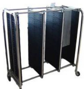
SL-603A wózek transportowy ESD Nr kat. 202859

Pojemność: 300 slotów na PCB z możliwością dołożenia ścianek Wysokość prowadnicy slotu: 5mm Odległość między slotami: 10mm Rezystancja powierzchniowa: 10^6 - 10^{11}\Omega Wymiary (szer × gł × wys) : 900 × 550 × 1300 [mm]