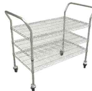
SL-606A wózek transportowy ESD Nr kat. 202886

Pojemność: 24 racki typu L Rezystancja powierzchniowa: 10^6 - 10^{11}\Omega Wymiary (szer × gł × wys) : 1050 × 540 × 1400 [mm]