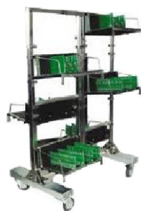
SL-605 wózek transportowy ESD Nr kat. 202862

Pojemność: 300 slotów na PCB z możliwością dołożenia ścianek Wysokość prowadnicy slotu: 5mm Odległość między slotami: 10mm Rezystancja powierzchniowa: 10^6 - 10^{11}\Omega Wymiary (szer × gł × wys) : 900 × 550 × 1300 [mm]