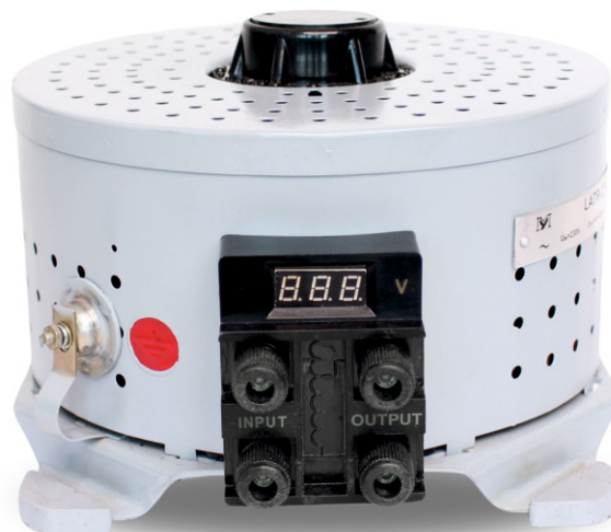
LATR 2,5-I nr kat.: 120001