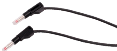
Nr kat. 105061