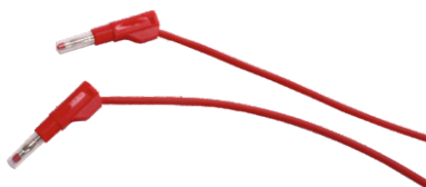
Nr kat. 105060