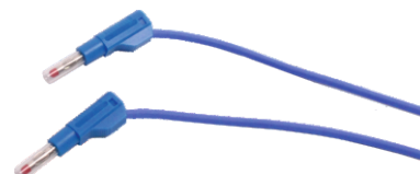
Nr kat. 105062