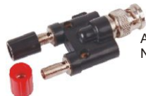
Adapter Nr kat. 112703