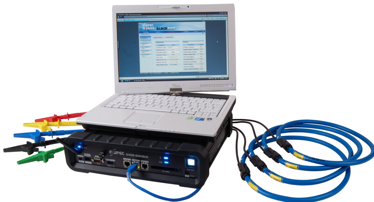
Rys. 1 ELSPEC BLACKBOX G4500 Portable