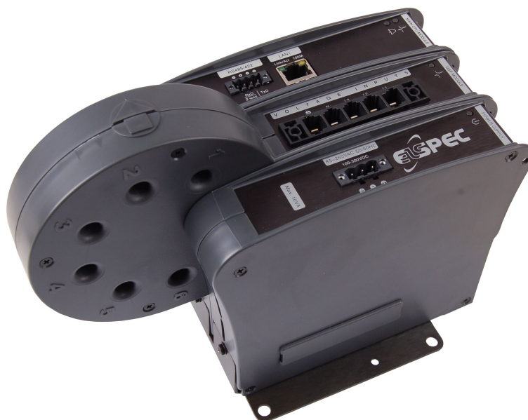
Rys. 2 ELSPEC BLACKBOX G4400

ELSPEC BLACKBOX G4000 może rejestrować wszystkie parametry sieci i wyliczać wartości skuteczne, harmoniczne oraz pozostałe parametry. Rejestrowane dane są kompresowane za pomocą opatentowanego algorytmu PQZIP (w stosunku 1000:1) i przechowywane w pamięci urządzenia, co pozwala na zachowanie zarejestrowanych parametrów z rozdzielczością do 1024 próbek/cykl z okresu ponad jednego roku. Dzięki zastosowaniu 12 przetworników A/D pracujących równolegle z próbkowaniem max. 250000 próbek/s każdy, przyrząd zapewnia nieporównywalną dokładność oraz uniknięcie opóźnień między kanałami. Analizator firmy ELSPEC mierzy napięcia, prądy, częstotliwość, wyznacza moce (czynna, bierna, pozorna) i współczynniki mocy, energię, umożliwia rozbudowaną analizę zawartości harmonicznych do 511