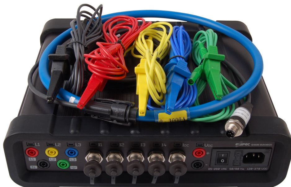
Rys. 4 ELSPEC BLACKBOX G4500 Portable

Pożądaną funkcją jest również możliwość przeprowadzenia kalkulacji kosztów zużycia energii według stawki stałej lub zmiennej wykorzystując metodę okresowej rejestracji wartości energii czynnej i biernej przez zdefiniowany okres czasu (typowo 15 min.) Całkowity koszt energii jest następnie wyliczany co pozwala zapewnić elastyczność kalkulacji umożliwiając na przykład porównanie wyliczeń według dowolnego planu taryfowego. Przyrząd pozwala również monitorować na bieżąco temperaturę wewnątrz w celu zapewnienia warunków dla maksymalnej dokładności oraz na zewnątrz po podłączeniu opcjonalnej sondy temperatury Pt100.