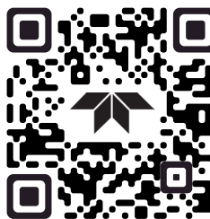
Aplikacje FLIR Apple Store