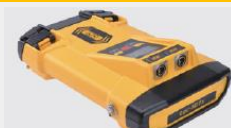
Loc5DTx 5W Dwie częstotliw. jednocześnie