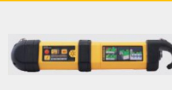
VM-550FF / VM-560FF 1W