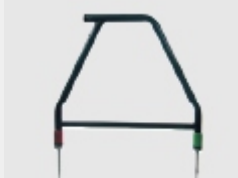
Ramka A-Frame – lokalizator uszkodzeń (jest w zestawie)